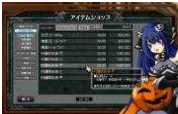
ゲーム画面「ショップ」