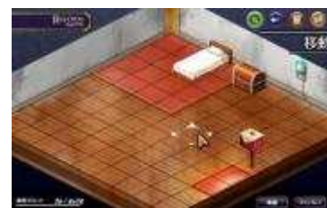
ゲーム画面「もようがえ画面」