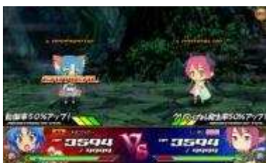
ゲーム画面「いたずらバトル画面」