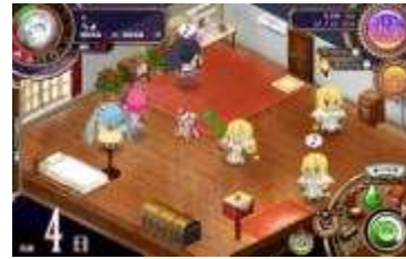
ゲーム画面「あそぶ」