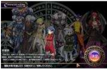
ゲーム画面「キャラクター作成」

素材の収集や、家具の合成には、時間がかかります。 購入したアイテムの使用によって、合成時間の短縮や成功率を高めることができます。 ゲーム画面例：