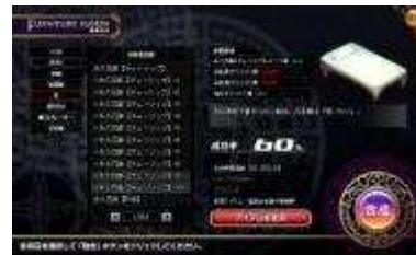
ゲーム画面「家具合成画面」