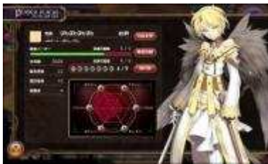
ゲーム画面「ステータス画面」