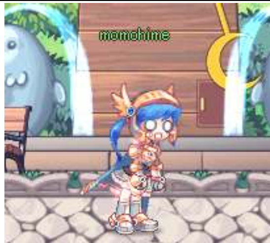
たくさんのエモーション

(c)2006 Actoz Soft., All rights reserved. (c)2006 GMO Gamepot Inc. All rights reserved.