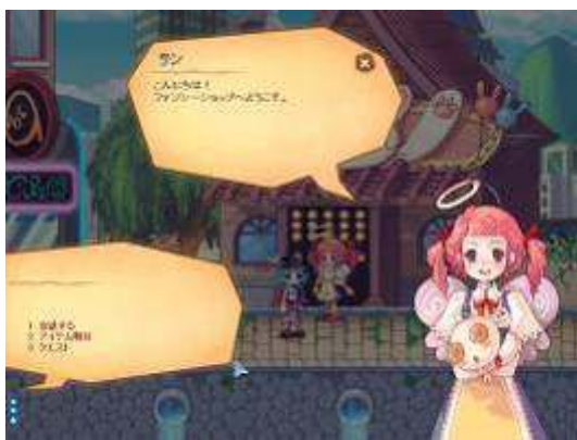
ゲーム内にあるファッションショップ

『ラテール』は、レベル上げやストーリーを追いかけるだけのゲームではありません。戦闘用の武器や防具だけでなく、ファッションアイテムも充実しています。このファッションアイテムは、戦闘用のアイテムとは別に装備することができるので、ファッションを楽しみつつ戦闘能力を上げることができます。ファッションアイテムは服だけではなく、帽子、ピアス、ブレスレット、靴、ストッキング、指輪などたくさんの箇所に装備をすることが可能になっています。さらに、季節ごとに追加される豊富な限定アイテムや、髪型や顔を変更できるビューティーショップなど、あなたのコーディネートしたいで自分のアバターキャラクターをより個性的なものにできます。