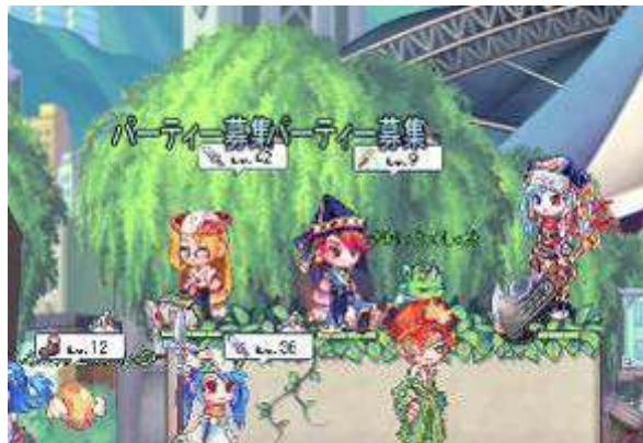
仲間と一緒に冒険！