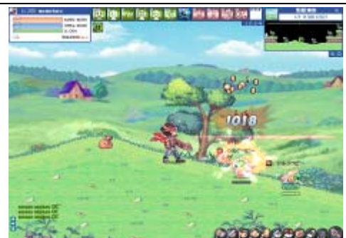
タイプ別の個性豊かな戦い方