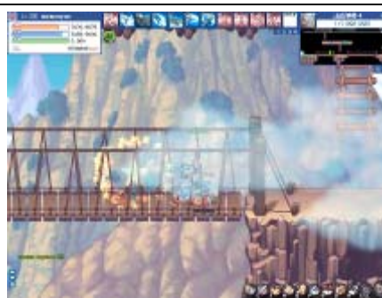
奥が深い攻略しがいのあるマップ