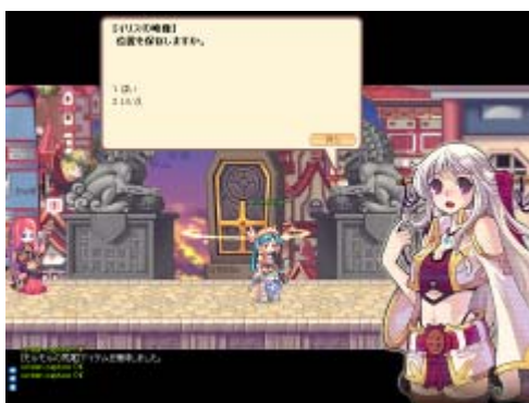
プレイヤーを導く謎多き少女イリス