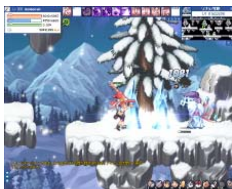
多種多様なスキル